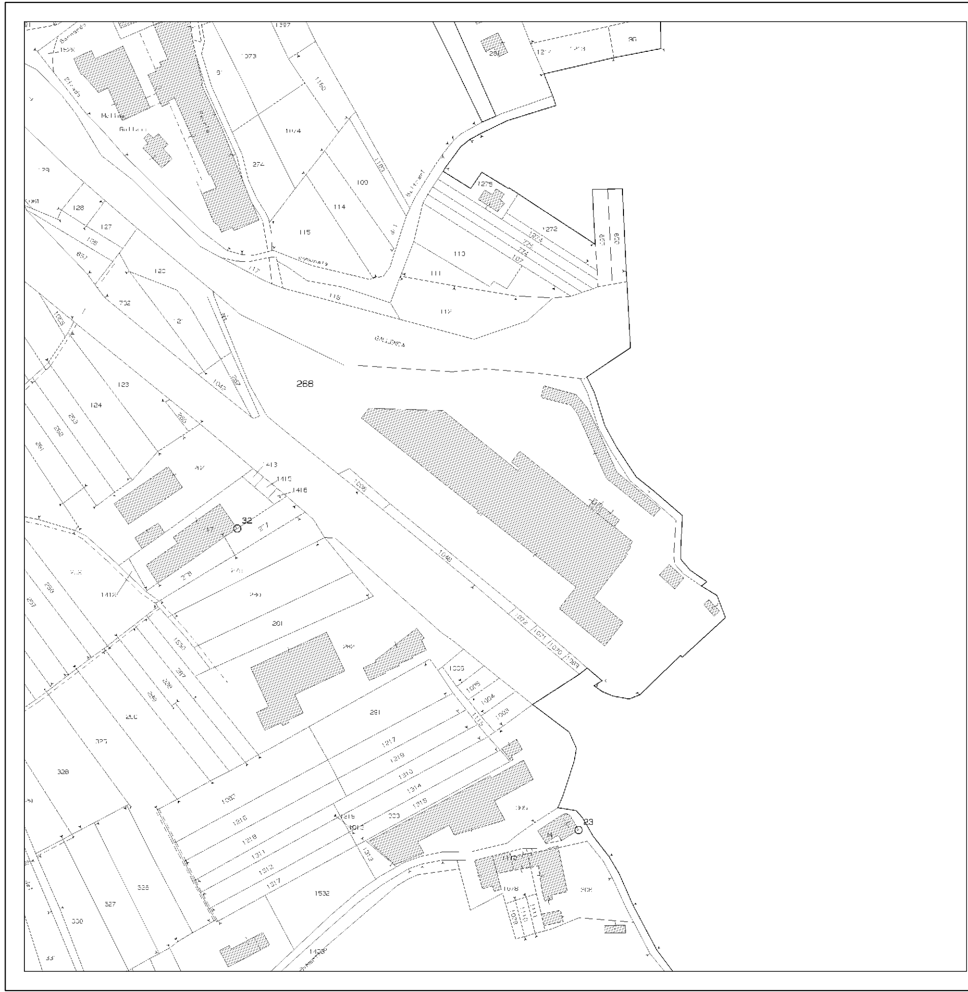
ESTRATTO DI MAPPA - FOGLIO 6 - MAPPALE N. 268 - SCALA 1:2000